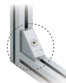
アルミフレームを 簡単組立 PJ ジョイント