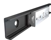
取り付け誤差を吸収できる 高耐久ガイドレール T-RACE