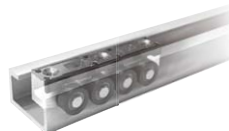
クリアランスのある 取り付けやすいガイドレール LGB30

リードタイムの短縮につながるロボット周辺部品や、安全柵用部品をご用意しております。